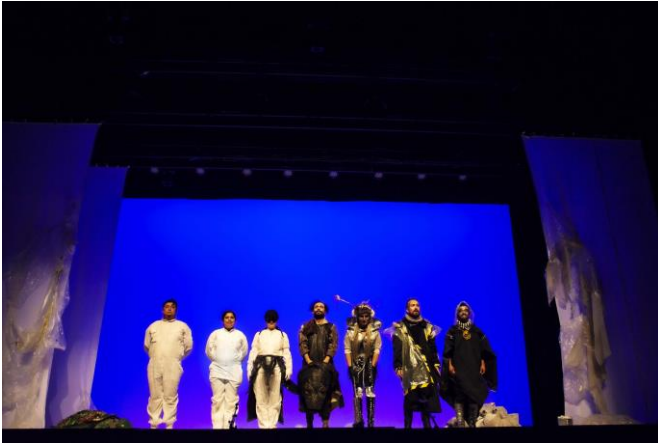
La ciudad de la fruta - 28 y 29 de enero