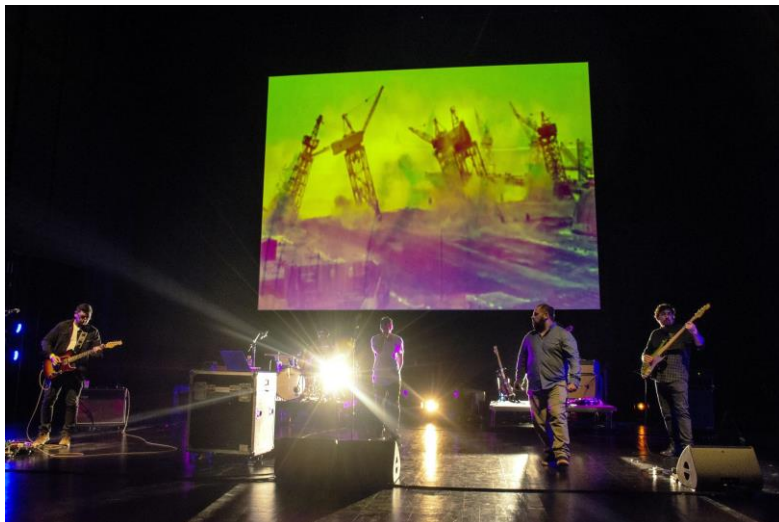
Congreso del Futuro - 14 de enero