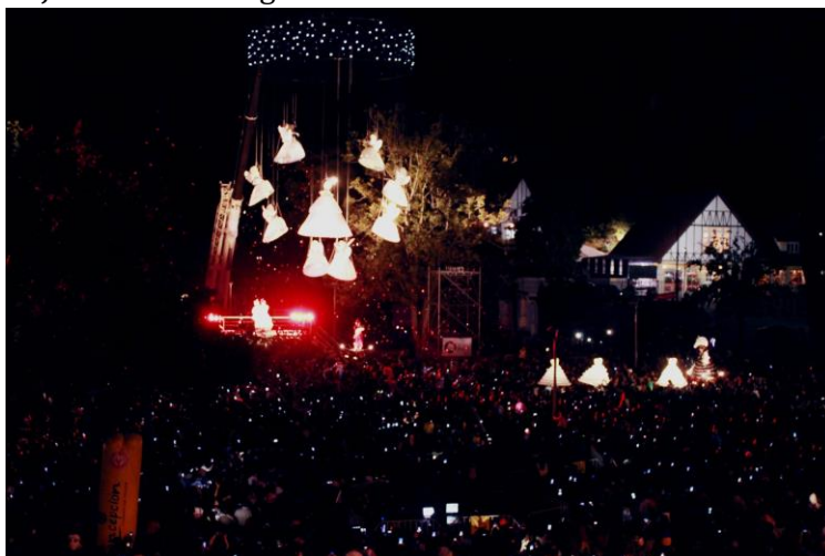
El Jardín de los Ángeles - 15 de enero