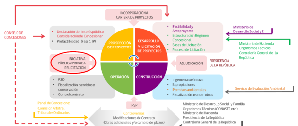
Figura 4: Ciclo de vida de un proyecto concesionado.