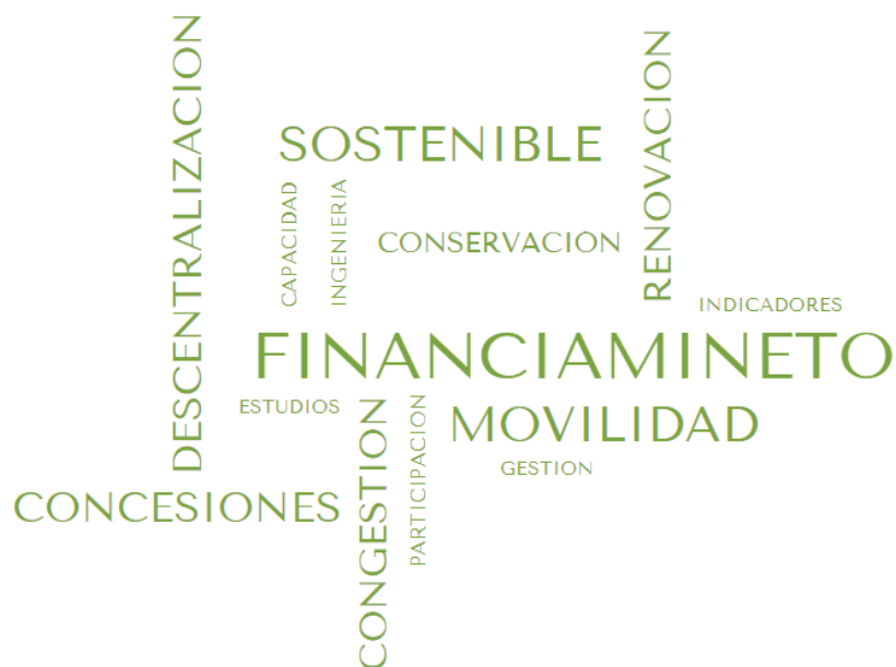
Imagen 1: Nube de palabras tercera sesión.