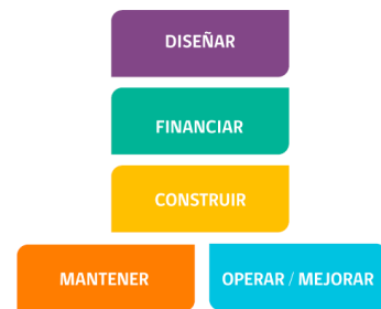
Figura 3: Que implica un proyecto de infraestructura.

También se pudo conocer cuáles son los actores externos, como se desarrolla el ciclo de vida de un proyecto concesionado y cuales son sus variables de licitación.