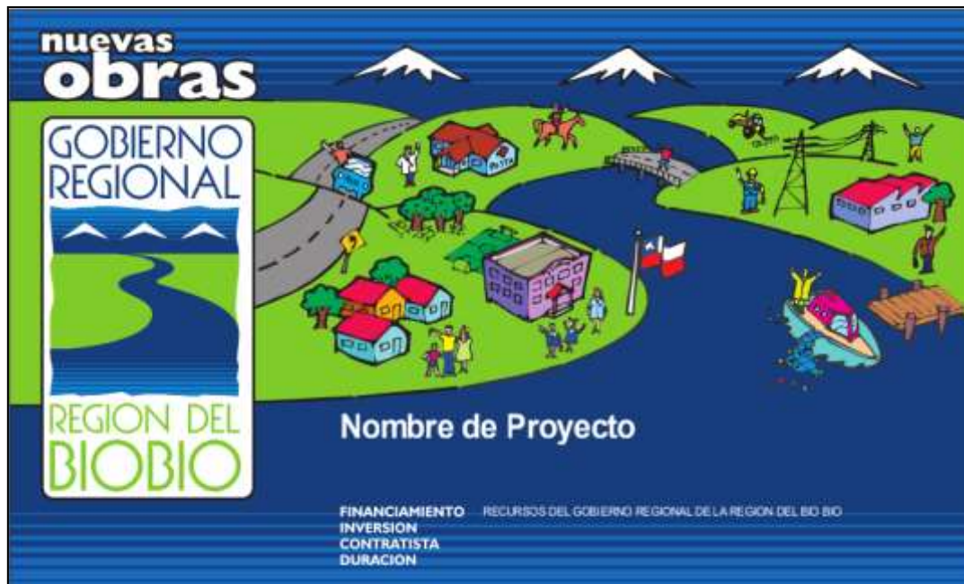
Ilustración 2: Letrero de obras